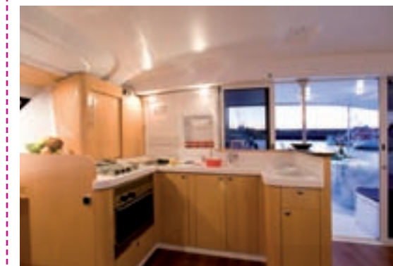
Classique, la cuisine manque cependant de quoi bien se caler en navigation...