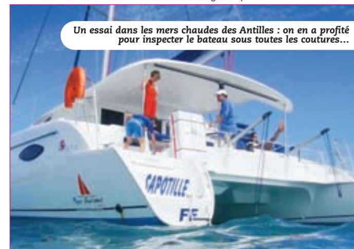
Un essai dans les mers chaudes des Antilles : on en a profité pour inspecter le bateau sous toutes les coutures...

même poste de barre on déroule le génois et on peut enfin couper les moteurs pour profiter de la carène de Joubert-Nivelt. Car c'est là la bonne surprise de cet essai : l'Orana se comporte vraiment bien sous voiles. Dans la baie protégée, sur une mer parfaitement plane, et avec 15 nœuds de vent, le cata se propulse rapidement à 8 nœuds. A 20 nœuds, il se maintient entre 10 et 12 nœuds, sans avoir besoin de jouer sur les réglages de voiles outre mesure. N'oubliez pas que ce bateau n'est pas neuf, que ses voiles de location ont déjà une bonne demi saison et qu'il est bien chargé... Alors on peut facilement imaginer qu'avec les nouvelles voi-