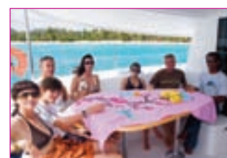
Autour de la table de cockpit, on tient à huit : idéal pour recevoir les amis...

facile et les manœuvres de port ne posent aucun problème : du poste de barre la vue est excellente sur l'avant comme vers l'arrière. Il faudra seulement se méfier du haut franc-bord au moment d'embarquer après avoir lâché les amarres... Avec 2 x 30 cv, l'Orana atteint rapidement sa vitesse de croisière dans un silence satisfaisant. Avec le nouveau plan de pont, une seule personne peut facilement hisser la grand-voile tout en maintenant le catamaran face au vent. Les winches sont de bonne taille, et la manœuvre ne prend que quelques minutes sans effort démesuré. Du