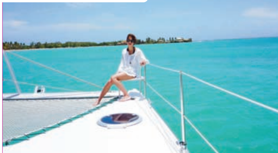
Un catamaran qui donne envi de voyager...

les à corne (CST) que nous prépare le chantier, l'Orana gagnera encore en vélocité.