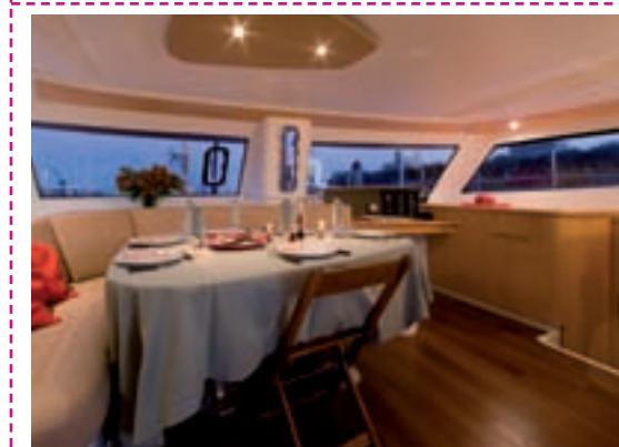
A l'intérieur, on retrouve l'ambiance chère au chantier : c'est confortable, pratique et agréable à vivre.