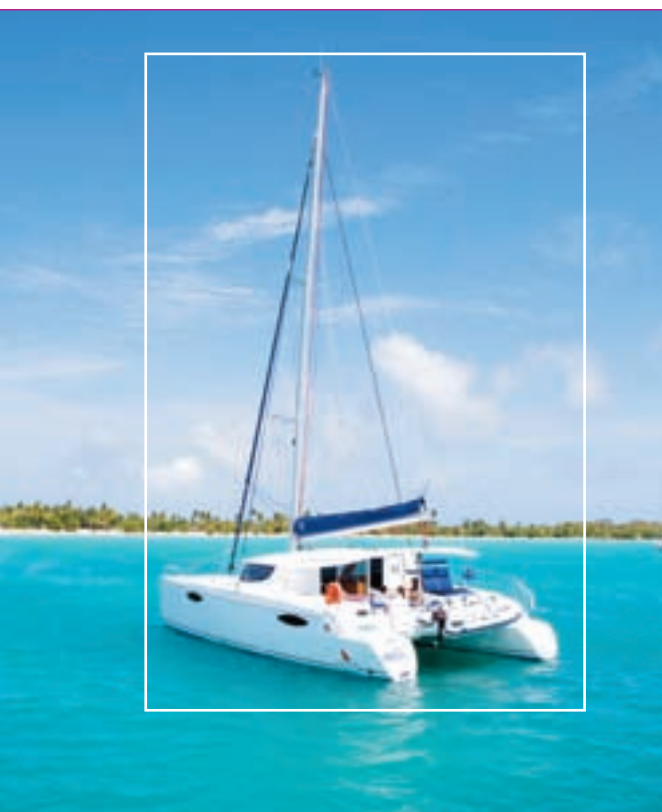
La Martinique, plage des Salines : un endroit exceptionnel pour cet essai de l'Orana 44...