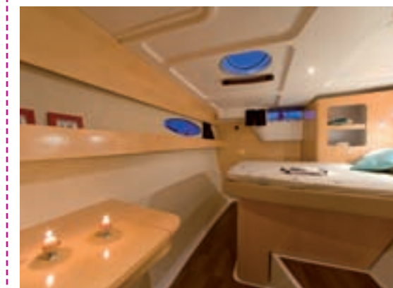
Les cabines sont vraiment agréables, surtout avec les tons de bois choisis par le chantier.